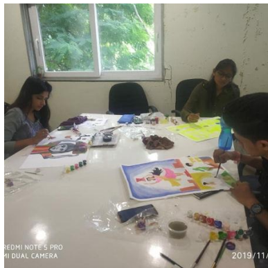
Participants preparing their concepts

Budding artists registered with partner organization Karmasu arts were invited at UHCRCE office to orient them on child rights theme and create sample paintings or concepts which will be eventually painted on the school wall. The activity was held between 18 artists at morning 9-1 in afternoon on 14 th November 2019 to create concepts on A3 size pages.