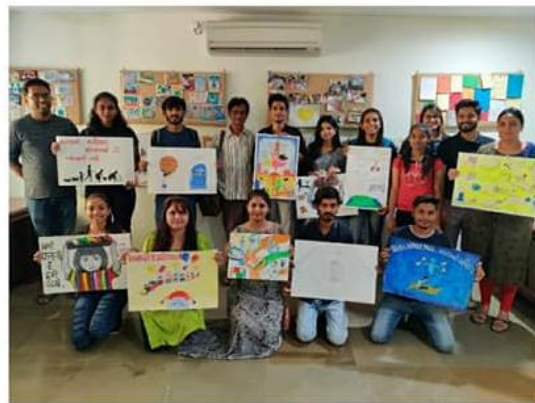
Paintings prepared by participants at UHCRCE

A day before the event, walls were selected in each school and circulated to all the artists and network partners through Whatsapp. Colours were arranged by the artists, they were helped by 5 student volunteers from each school they worked. The schools in which wall painting activity was carried out were Nagar Prathmik Shikshan Samiti with numbers: 204,205, 142,210,211,212,326,208,209,197,198,206,207,202